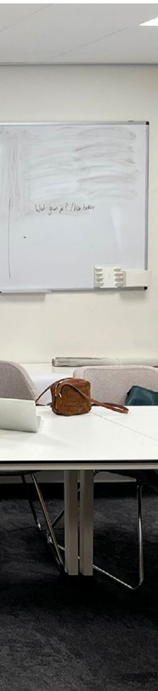
Uitleg van de film voor de klas