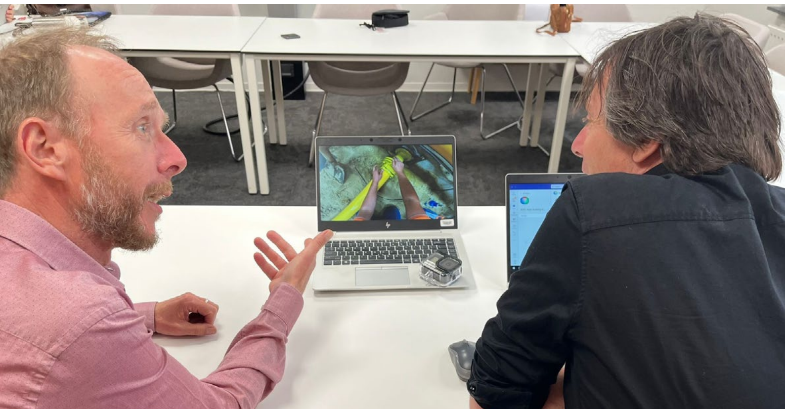
Een docent die napraat met een student

van een kijkvraag kan bijvoorbeeld zijn; zijn er dingen die anders gaan, dan dat je op basis van de theorie verwacht?