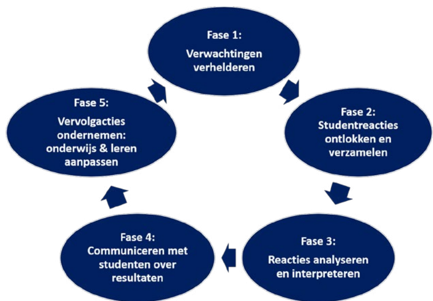
Figuur 1. Learning progression

Een LP wordt in de literatuur gedefinieerd als: een beschrijving van steeds complexere en diepgaandere manieren van denken en doen in een bepaald domein (Heritage, 2008; Shepard, 2018). Alonzo (2011) vergelijkt een LP met een landkaart. Zo'n landkaart beschrijft het eindpunt op de kaart: waar gaat de lerende heen? Dit kan gaan om de leerdoelen van